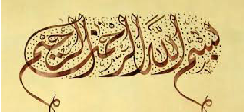
Gambar 2: Contoh Khat Diwani Jali